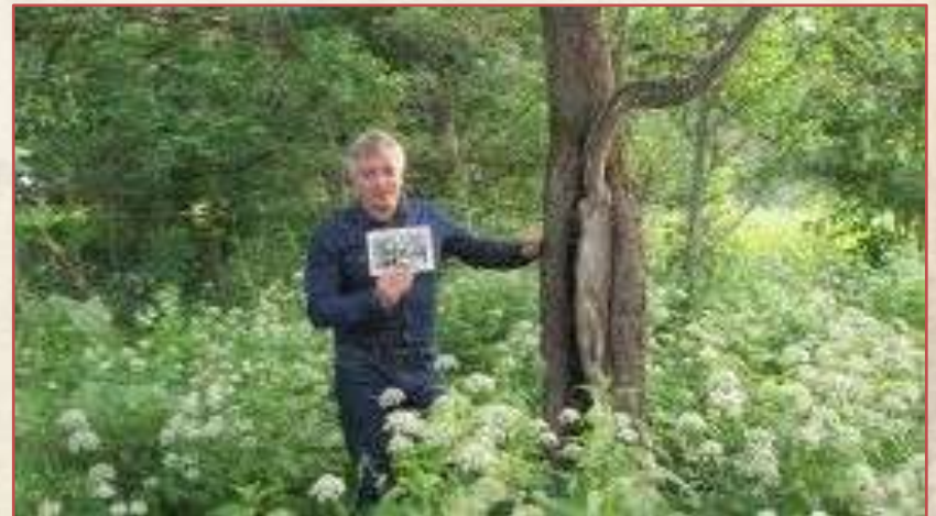
Двоюродный правнук Ивана Ивановича на месте, где ранее стоял дом Кибовских