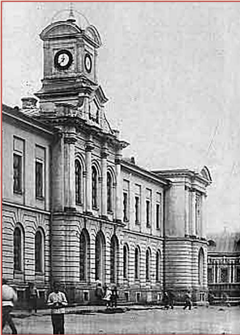
Московская сельскохозяйственная академия имени К.А. Тимирязева, фото начала XX века