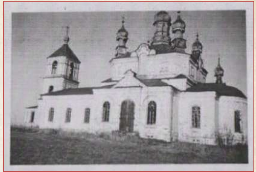
Церковь Успения Пресвятой Богородицы в селе Дентялово Смоленской области